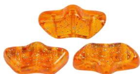
26 Délos par Puca®-Paris