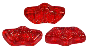
26 Délos par Puca®-Paris