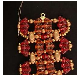
52) Passer dans la R11, la P3, la R11