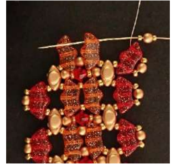
40) Placer 1 R15, 1 P3, 1 R15 dans le 3 ème trou de la Délos