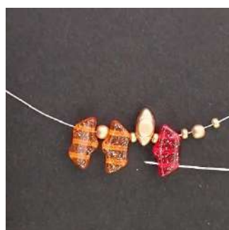
2) Passer dans le 3 ème trou de la Délos