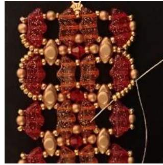
59) Passer dans les 6 R11