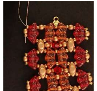
48) Passer dans la P3, la R11