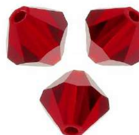
12 Toupiés 4 mm (T4)