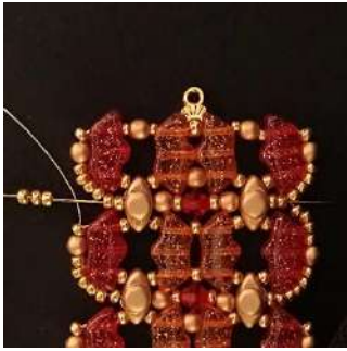
57) Placer 3 R11 dans les 2 R11 et passer dans toutes les perles et les 2 R11