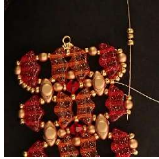
54) Placer 3 R11 dans la R11, la P3, la R11