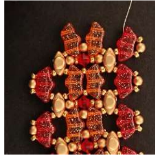
39) Répéter l'étape 11 à 30, comme ceci