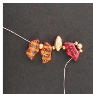
3) Comme ceci