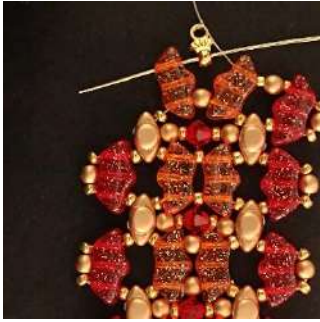
41) Placer 1 Pilos dans la Délos suivante