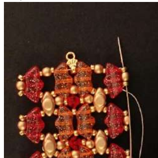
46) Passer dans la R11, la P3, la R11