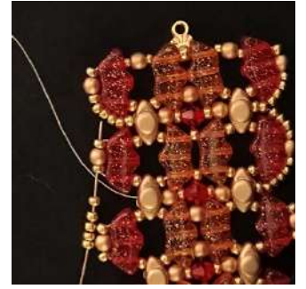
56) Placer 5 R11 dans la R11, la P3, la R11