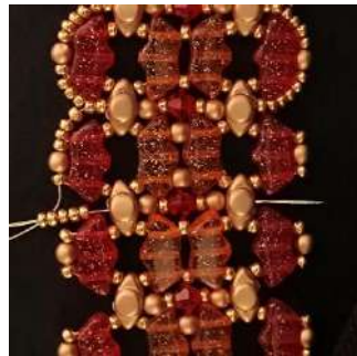
62) Placer 5 R11 dans le trou du milieu de la Volos et passer dans toutes les perles