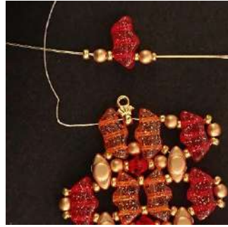
42) Placer 1 R15, 1 P3, 1 R15, 1 Délos, 1 R11, 1 P3, 1 R11