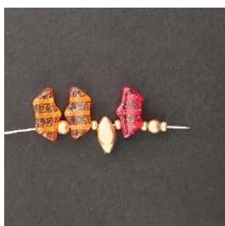
1) Placer 1 Délos, 1 P3, 1 R11, 1 Volos, 1 R11, 1

Attention à bien placer les Délos et des Volos comme sur les photos.