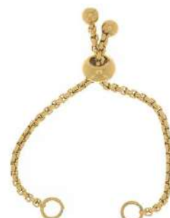
1 Fermoir au choix