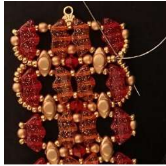
58) Passer dans les 4 R11, la P3, comme ceci