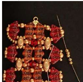
50) Placer 5 R11 dans la R11, la P3, et la R11