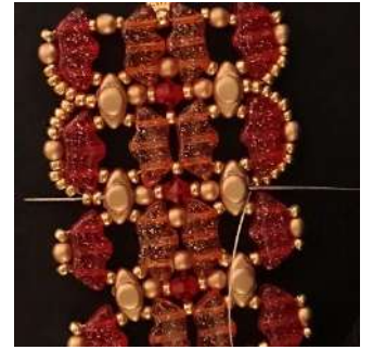
60) Passer dans toutes les perles et les 2 R11