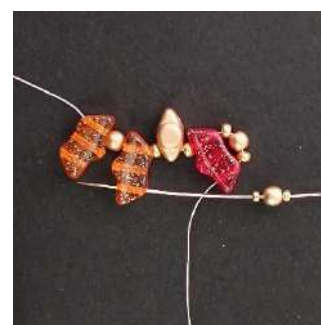
4) Placer 1 R15, 1 P3, 1 R15 dans le 3 ème trou de la Délos