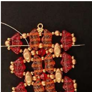
45) Passer dans toutes les perles