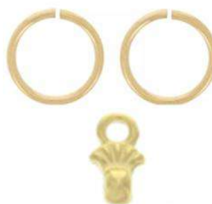
2 anneaux de 4 mm 2 Cymbal Pilos