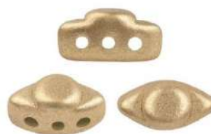
24 Volos par Puca®-Paris