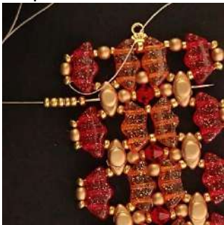
49) Placer 5 R11 dans le trou du milieu de la Volos et traverser toutes les perles