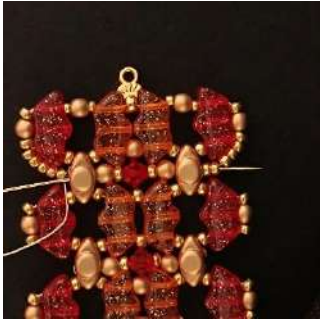
53) Passer dans toutes les perles, placez vous dans les 2 R11