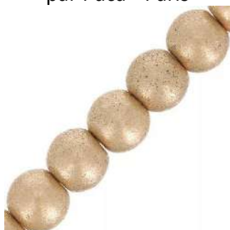
66 Perles rondes 3 mm (T3)