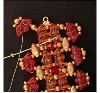
44) Placer 1 R11 dans la Volos, la R11