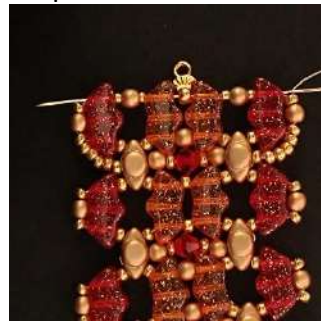
51) Passer dans toutes les perles