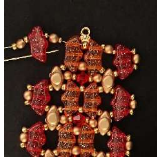
43) Passer dans le 1 er trou de la Délos