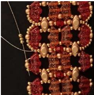
61) Placer 3 R11 dans la R11, la P3, la R11