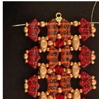
47) Passer dans toutes les perles