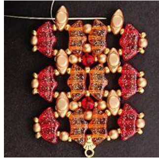
38) Répéter les étapes 10 à 36, 3 fois