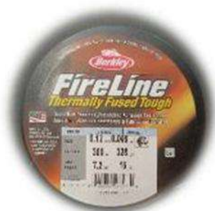
Fil Fireline 0.12