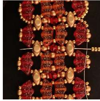
55) Placer 5 R11 dans le trou du milieu de la Volos et traverser toutes les perles