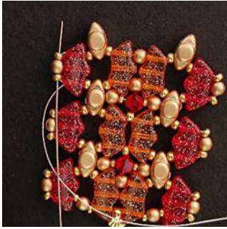
37) Passer dans la R11, la P3, la R11