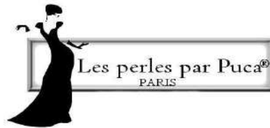
Schéma « Magie de Noël » © par PUCA®