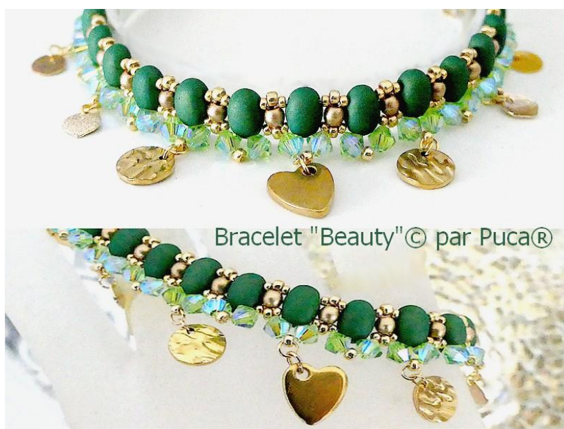
Bracelet "Beauty" © par Puca®